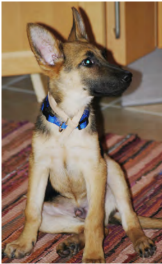
Jeder fängt mal klein an (o.), da war ich erst 12 Wochen alt. Auf dem rechten Bild seht ihr mich und meinen großen Freund Merlin beim rumtoben